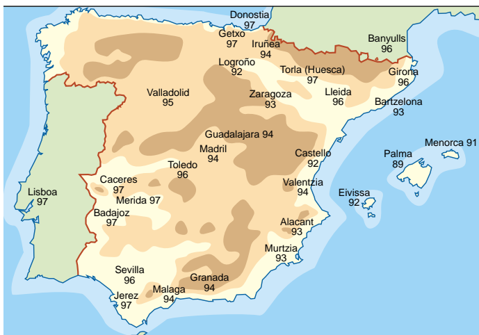
1. mapa: Cacyreus marshalli tximeletak Iberiar Penintsulan duen hedapena, harrapatuak aileen aipuen arabera (lekua eta urtea jarri dira).