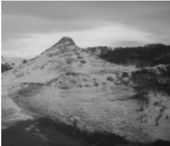
Hilabete honetan elurra ager liteke Euskal Herrian. Argazkian, Ttulture, Aralarren.

rik ez den bitartean, odol hotzeko animalia gehienak zuloren batean ezkutatu eta garai epelagoen zain ditugu. Era berean, intsektuak eta oro har, ornogabeak ere ez dira sobera ikusten. Hauetariko askok negua arrautz edo larba forman pasatzen dute eta kanpoan dabilzan helduak ez daude garai bizkorrean. Etxean adibidez, euli gutxi eta haiek motelduta ditugu eta udan ez bezala, erraza da txaplata jartzen direnean gaintetik kolpe batez kentzea.