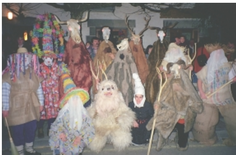
Fauna bitxia Nafarroako ihauterietan. Hil honen bukaeran Zubieta, Ituren, Leitza eta beste zenbait herritan ospatzen dituzte ihauteriak. Argazkian Leitzaiko ihauteriak.

Zuhaitz-tarte epeletara sartzeaz gain, haizeak garbitutako mendi-hegalak bilatzen dituzte aztarrিকা bada ere belarra aurkitzeko. Orkatzak ere baso eta sastrakadietan sarturik ditugu eta garai honetan arren adarrak luzatzen ari dira. Azaro inguruan, urtero bezala, adarrak galdu zituzten eta orain, belusa batez estalirik hazten hasi zaizkie.