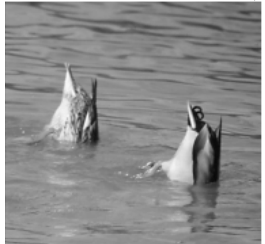
Hezeguneak ur-hegazitik gainezka daude. Argazkian, basahateak elikatzen.

Abendua eta otsaila bitartean errun dezaketen arren, sai arre eta ugatz gehienek urtarrilean jarriko dute arrautza. Habiak, inor gutxi iristeko moduko amildegietan, harkaitz-zulo eta erlaitzetan paratzen dituzte eta gurasoetako bat erabat gainean egoten da arrautza hoztu ez dadin. Mendizaleak eta, batez ere, eskalataileak baldin bazarete, kontuan eduki Etxauri, Urkiola eta abarren, ugalketa-garaian sarraskijale hauen habi inguruetan ibiltzea ez dela batere komeni.