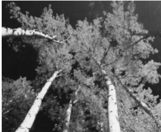
Europako hogeita hamar herrialdeetako basoetan 600.000 zuhaitz baino gehiago ikertu ondoren atera dituzten ondorioak kezkarriak dira.

belakietako espikula edo silizezko eztenak batez ere. Hauek dozenaka zentimetro luzekoak izan daitezke 120 metroko sakoneran egoten den Rossella racovitzæ espeziearekin badira. Laser izpiekin egindako saiakuntzetan ikusi ahal izan denez, espikulek argia belakiaren gorputzeraino bikain eramaten dute. Gorputzean Ostreobium izeneko alga berde txikia belakiarekin sinbiosian bizi da, baina