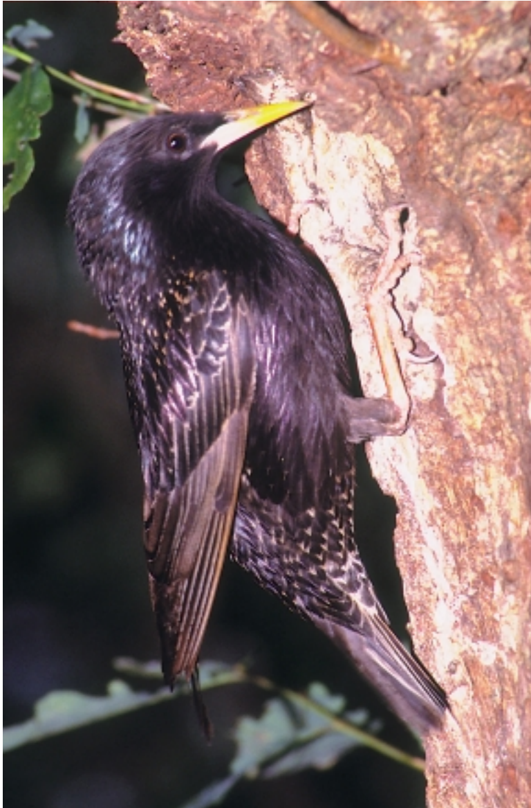
Kopuru txikian bada ere, gaur egun kantauri aldeko isurialde osoa betetzera ailegatu da arabazozo pikarta.

handixeagoa delako eta buztan luzeagoa duelako, eta boteka ibiltzen den bitartean arabazozoak oinez egiten duelako. Arabazozo pikarta ( Sturnus vulgaris ) eta beltza ( Sturnus unicolor ) bereiztea ez da hain erraza. Biak tamaina berdinekoak dira: 21,5 cm-ko luzera eta 75-90 gramoko pisukoak. Lumajea halaber, antzekoa dute. Oso ilunak dira, ia beltzak, irisazio eta erreflexu urdin, berde eta more deigarritz apainduta. Neguko janzkeran bi espezieak bereiz-