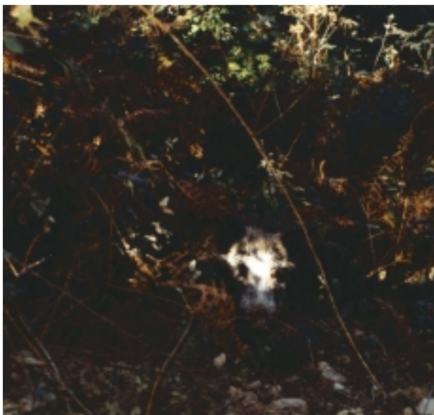
Basurdeak kamuflajerako izugarritzko erraztasuna eta gaitasuna du.