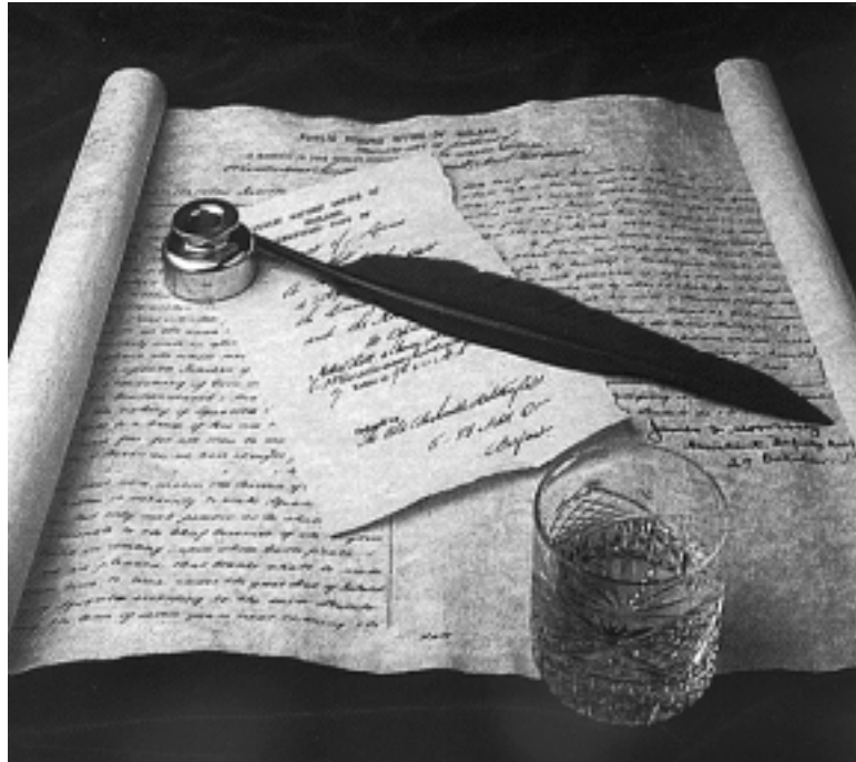
Lehen idazkerak adierazpide iraunkorrek bilatzen hasi orduko agertu ziren. Taldearen ideiak, bizipenak, etab. finkatzeko beharrak abiarazi zuen idazkeraren sorrera.

Zurean eta harrietan grabaturik agertzen dira ikur horiek eta landareak, abereak, giza irudiak, lanabesak edota astroak irudikatzen dituzte. Ikur horietako bakoitzak ideia bakarra isladatzen duenez, pentsamenduaren margolaritza izenaz ere ezagutzen da. 1828. urtera arte ez zen hieroglifikoak interpretatzerik lortu. Urte horretan berriz, Chanpollion egiptologo frantseak Roseta izenaz ezagutzen den harria irakurtzea lortu zuen eta gerora, hieroglifikoak interpretatzeko erabili izan da. Lorpen itzela izan zen hura eta besteak beste, hieroglifikoaren garapenean sistema eta garai desberdinak bereiz daitezkeela jakin da. Urteetan zehar hieroglifikoaren estiloa samurtzen joan