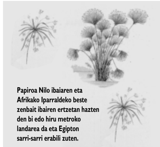
Papiroa Nilo ibaiaren eta Afrikako Iparraldeko beste zenbait ibaiaren ertzetan hazten den bi edo hiru metroko landarea da eta Egipton sarri-sarri erabili zuten.

Egiatzko idazkeratzen jo dezakegun lehen komunikazio-sistema egiptoarren hieroglifikoak dira.