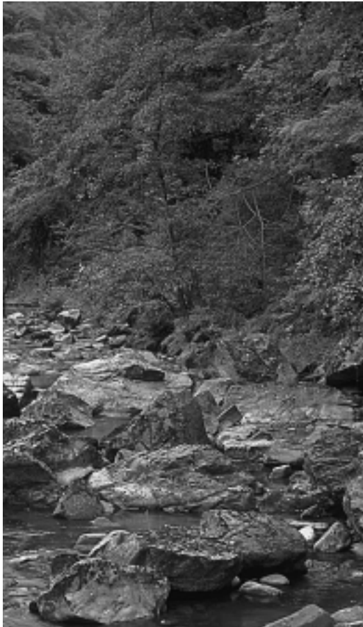
Ibaien ezagutza eta babesa bultzatzea da ibaialde programaren helburu nagusia.

Ez al dira horiek guztiak nahikoa arrazoi egoera larri horretaz kezkatzen hasteko? Baietzean daude ibaialde programaren arduradunak eta horrela, ibaiak eta ibarrak hobeto ezagutzea da egitasmoaren ardatza. Hori guztia nola bidera daitekeen irakurle, oso bestelako kontua da.