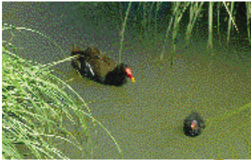
Uroiloaren kumeak nidifugoak dira. Habia utzi eta berehala ikasten dute igerian eta bazka bilatzen.

Uretatik altxatzeko ur-gainean palastaka laisterka egiten du, abiadura hartu eta aireratu ahal izateko. Eta hegan hankak oso era bitxian eramaten ditu; zintzilik hasieran, eta atzerantz luzaturik gero, buztana baino luzeagoak direnez, garbi ageri direlarik. Altuera handirik lortu gabe hegaldi labur baten ondoren jaitsi egiten da normalki. Beraz eta arriskurik somatzen badu, hegaz egitea baino, ezkutalekurantz korrika egitea nahiago du uroiloak, azken hau ezin hobeto egiten baitu.