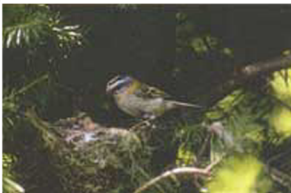
Konifero, ipuru zein huntzaren hosto-lartean, erregetxo bekainzuriaren habia ongi gorderik egoten da.

pagadi, artadi zein beste baso eta sastrakadi batzuetan ere topa dezakegu. Herri handietako parke eta lorategietako zuhaitzak halaber, atsegin zaizkio. Bestalde, lautada eta bai-larelatik, 1.600 metroraingo daiteke mendian.