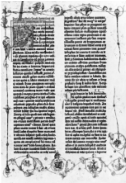
Zurezko plantxa erabiliz lortutako orrialdea. Inprimatu ondoren irudikatzen zen.

menduetatik aparte egon. Hasiera-hasieratik inprimategiak oso harrera ona lortu zuen gure herrian eta ordutik gaurko egunetaraino, hortxe dugu hamaika moldiztegi, liburuak inprimatuz eta munduaren ondasun kulturalak gure geografiaren bazter guztietara zabalduz.