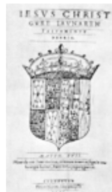
Etxepareren mendekidea izan zen Joanes Leizarraga artzain protestantearen liburua ere Euskal Herritik kanpo inprimatu ziren: Frantziako Rochelan.

Ordutik euskarazko liburu gehienek Euskal Herriko inprimategietan ikusi dute argia, XVIII. mendean Donostia, Baiona, Bergara, Iruñea, Tolosa eta Bilboko moldiztegiak erabilienak izan zirelarik. Edonola ere, euskarazko liburu asko eta asko kanpoko inprimategietan, Bordele, Pabe, Akitaniako Tolosa, Madril, Salamanca eta Parisen inprimatzen jarraitu zuten.