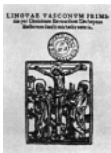
Euskaraz inprimatutako lehen liburua Bernart Etxepareren “ Linguae Vasconum Primitiae ” dela esan dezakegu (1545). Baina Etxepareren liburua ez zen Euskal Herrian inprimatu.