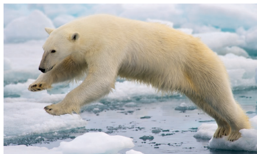
Hartz polarra mehatxatutako espezieen ikurra da.

Hegazti-gripearen azken izurria 2021ean identifikatu zen, eta, geroztik, milioika hegazti basati eta milaka ugaztun hil ditu H5N1 birusaren aldaera horrek mundu osoan. 2023ko abenduan, Kanadako Ingurumen Kontserbazio Sailak baieztatu zuen hartz polar baten heriotza ere eragin zuela birusak.