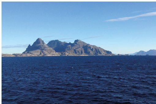
Norvegiako itsasoan ur sakonetako meatzaritza baimentzeko lehen pausoa eman dute.

Oraindik ez da ondo ikertu zer ondorio dituen ur sakonetako meatzaritzak itsas ekosistemetan. Egin diren lanek, dena den, garbi erakusten dute kalteak oso larriak izan daitezkeela.