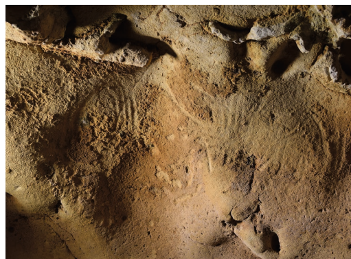
Ezkerrean, zirkuluaren panela deitutakoa; eta eskuinean, berriz, uhinen panela. ARG.: Jean-Claude Marquet/CC-BY 4.0.

Askotan eztabaidatu da artistikotzat edo sinbolikotzat jotzen diren halako adierazpenen egiletzari buruz, batzuek ukatu egiten baitute neandertalak horretarako gai izango zirenik. Alabaina, La Roche-Cotarden haitzuloko grabatuen egileak ezin ziren sapiensak izan, artean ez baitziren eremu hartara iritsi. Gainera, haitzuloaren barruko harrizko erre-mintak mousteriarrak dira, neandertalen kultura batekoak.