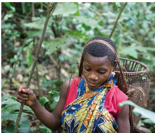
Baka taldeko emakume bat ehizean (Afrika Erdiko Errepublikak).

Mundu osoko 63 talde ehiztari-biltzaileen azken ehun urteko datuak aztertuta, ondorioztatu dute emakumeek ere ehizatzen zutela. Argi utzi dute gizon ehiztariaren mitoa okerra dela.