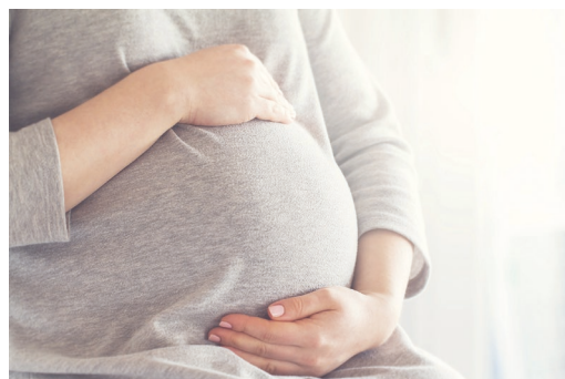
Haurdunaldiaren gastua orain arte kalkulatu dutena baino askoz ere handiagoa dela ikusi dute ikerketa zabal batean.

Horrela, ohartu dira zeharkako gastua guztizko energia-gastuaren % 5–25 dela uste izan bada ere egiazko gastua askoz ere handiagoa dela. Horrenbestez, ikertzaileen esanean, egin duten lana baliagarria da jakiteko zenbat kostatzen zaion ugaltzea espezie bakoitzari. ●