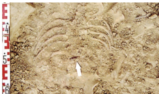
San Juan Ante Portam Latinam aztarnategiko hezurak. Tartean, arma gisa erabilitako suharri bat ere ageri da. ARG.: Aranzadiko Antropologia Saila.

Hala, 338 banakoetatik ia laurdenek traumatismoren bat dutela ikusi dute, eta gehiengoa mutil gazteak edo gizon helduak dira. Hortik ondorioztatzen dute haiek zirela gerretan eta borroketan parte hartzen zutenak, eta indarrez zauritzen eta hiltzen zirenak. Hala ere, haurren eta emakumeen gorpuak ere hilobiratu zituzten haiekin batera; batzuk geziz zaurituak edo hilda. Hortaz, adin eta sexu guztieta-ko pertsonen eragin zien indarkeriazko gertakariak.