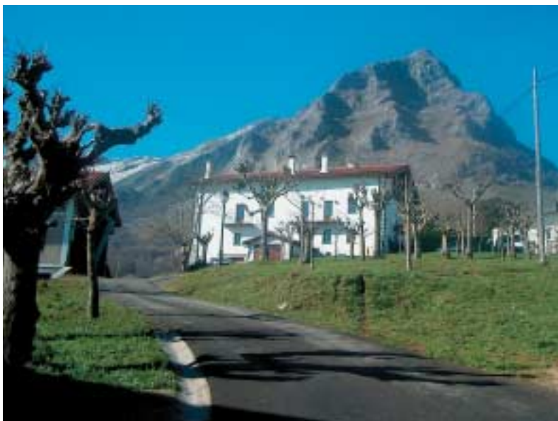
Baserri askotan, nekazaritza-jarduera bertan behera utzi eta etekin handiagoa ematen duten lanbideetan jarduten dute.