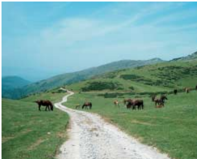
Azpiegiturak egokitu diren lekuetan, errazagoa da abeltzaintzan aritzea.

Karreraren iritiz, hori da egitasmoaren alde interesgarriena, alegia, erakunde publiko batek hartzen duela bere gain