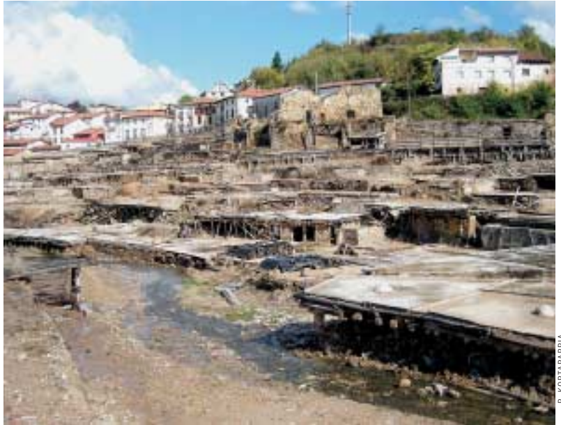
Santa Engrazia iturburua, haraneko nagusia.

Larrainak eta ubideak konpondu ondoren, gatza bideratzen zen larrainera. Larraina bete, mugitu, busti, bildu eta biltegiatu egiten zen. Eguzkiak, batez ere, eta haizeak, laguntzen bazuen, ura pare bat egunean lurrundu eta kristalizazio bidez gatza agertzen zen. Hura biltegiatu utzi, eta berriro hasten zen zikloa.