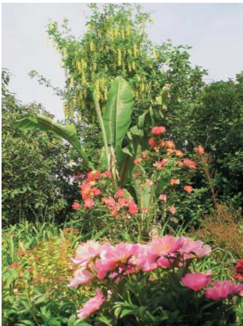
Peoniak eta Abisiniako bananondoa ondo-ondoan, Iturraranen.

PAGOETA INGURUKO KLIMA-KONDIZIO EPELEK POSIBLE EGITEN DUTE berez bateraezinak diren inguruneetako landareak elkartu eta inongo arazorik gabe bizi-tzea. Urte osoan gutxi gorabehera dozena bat egunetan jaisten da temperatura zero azpitik, eta udan ere ez da gehiegi igotzen. Mundu osoko 4.500 zuhaitz eta zuhaixka inguru dituzte Iturraran lorategi botanikoan; eremu handi bateko lorategi aberatsenetako bat da espezieei dagokienez, eta dituzten haritz- eta astigar-bildumak mundu-mailako bi edo hiru bilduma hoberenen artean daude.