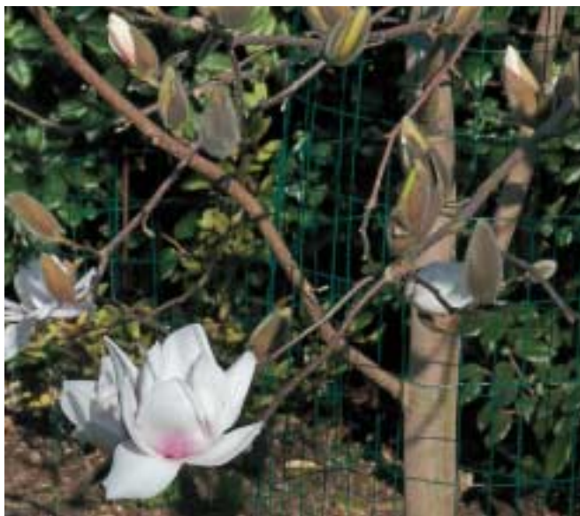
Pagoetako basapiztien eragina saihesteko, zuhaitz bat baino gehiago hesiz inguratu dute; adibidez Magnolia 'Milky Way' hibridoa.

Lorategian daudenean, egin behar-koak egiten dituzte, hala nola landa-