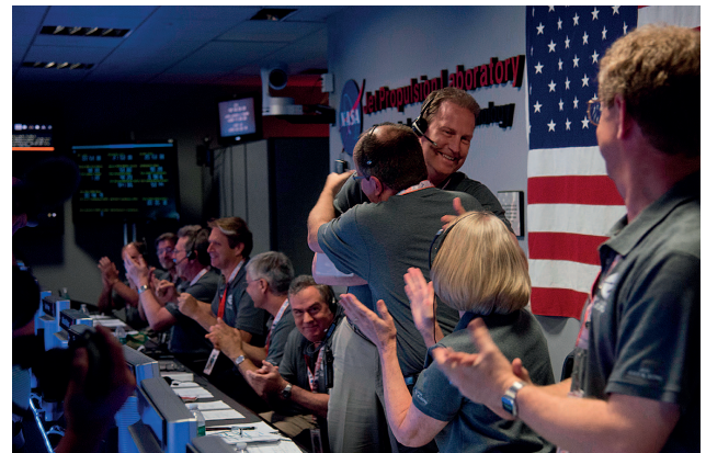
NASAKO kideak, Juno Jupiterren orbitan sartu dela ospatzen.