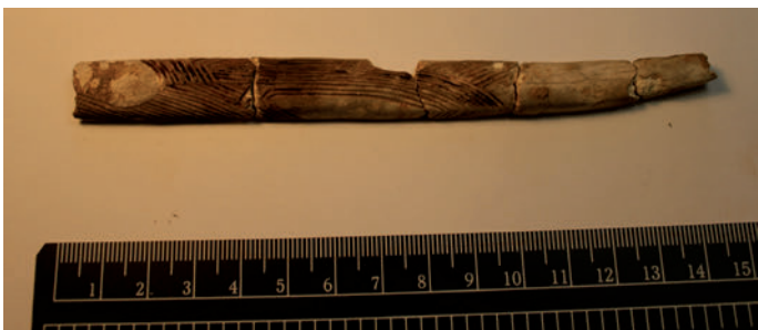
Gipuzkoako kobazuloan aurkitutako beste hagaxka.